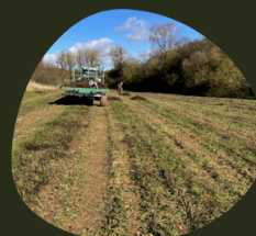
Ramassage des orties