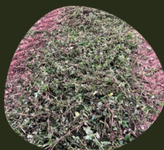
Ortie à terre