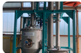
Explosion à la vapeur, Lermab

Des essais d'explosion à la vapeur ont été menés à des pressions entre 12 et 20 bars sur des fibres issues de la variété italienne Palazza et celle présente à la Ferme de La Bouzule.