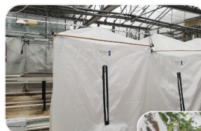
Utilisation de cage antipollen, EHP Roville aux Chênes

Des essais d'hybridation ont été réalisés en croisant la variété italienne Palazza avec des variétés finlandaise et allemande. Des semis en microparcelles sont prévus en 2026.